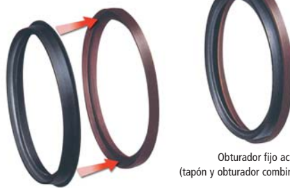
Obturador fijo acabado (tapón y obturador combinados)

El obturador de caucho va unido al tapón de plástico