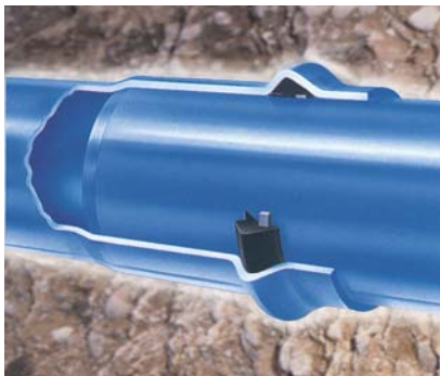
Tubo de presión para agua potable

Fabricamos obturadores de acuerdo a los requisitos de los clientes, incluyendo obturadores de fijación que incorporan nuestro diseño patentado Viploc™ . Este diseño incluye un anillo de retención que sujeta el obturador en una ranura dentro del tubo.