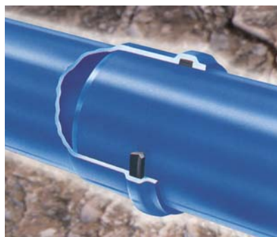
Tubo sin presión para aplicaciones de alcantarillado, desagües e industriales